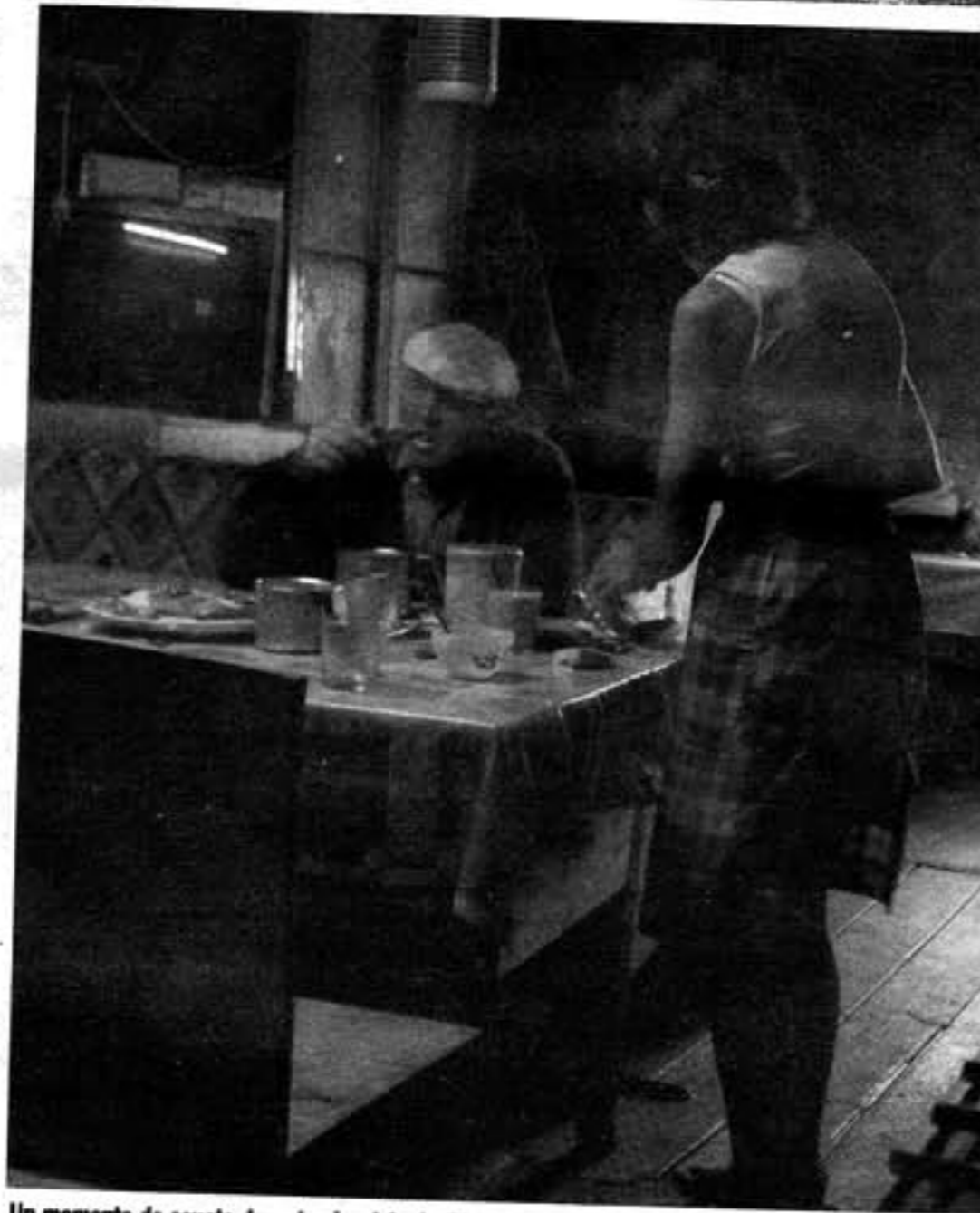
Un momento de asueto durante el rodaje de 'El Somni' / LAURE DELMAS